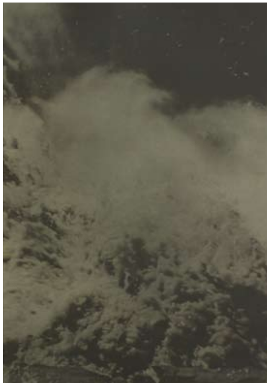
Dove Allouche Surplombs I_1 , 2008 Mine de plomb et encre sur papier, 100 x 70 cm