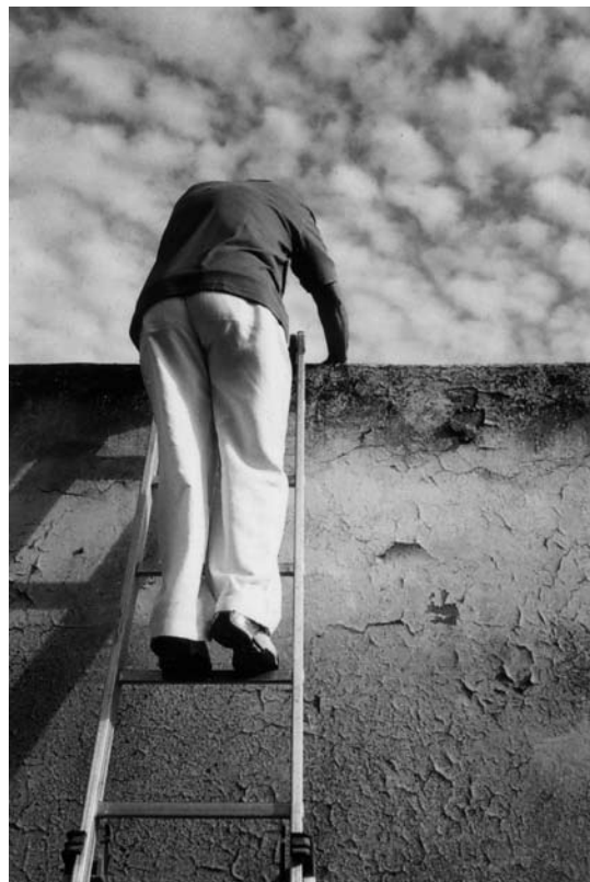
Dove Allouche Portrait de Ninetto Davoli 1, 2008 Tirage Duratrans, caisson lumineux, 120 x 180 cm