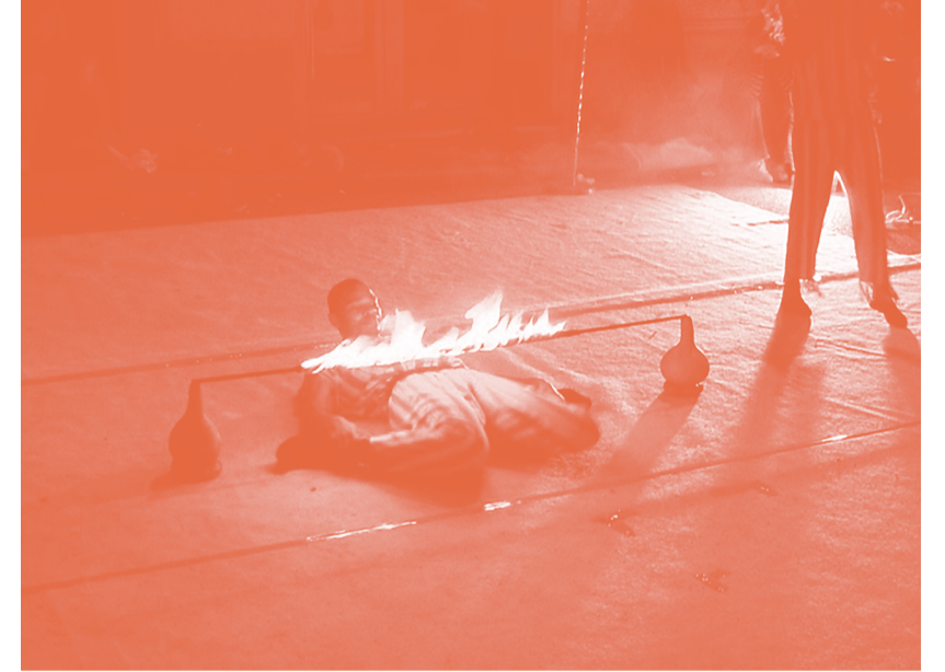
Danse du limbo

La vidéo Limbé évoque la danse du limbo. Originaire de l'île de Trinité-et-Tobago dans la mer des Caraïbes, le limbo fait partie de la cérémonie de la nuit Bongo où l'âme du défunt (le mort) est accompagnée dans un autre monde. Le limbo symbolise la transition entre l'ici et l'au-delà. La barre en feu, sous laquelle il faut passer les genoux en premier, représente la mort. Une fois dépassée, on se relève peu à peu pour atteindre une vie éternelle.