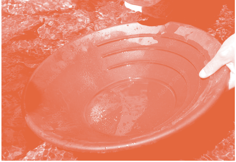
Une bâtee pour récupérer l'or (l'orpaillage)

Quels objets exposés ressemblent à la forme creuse et arrondie de la bâtee ?