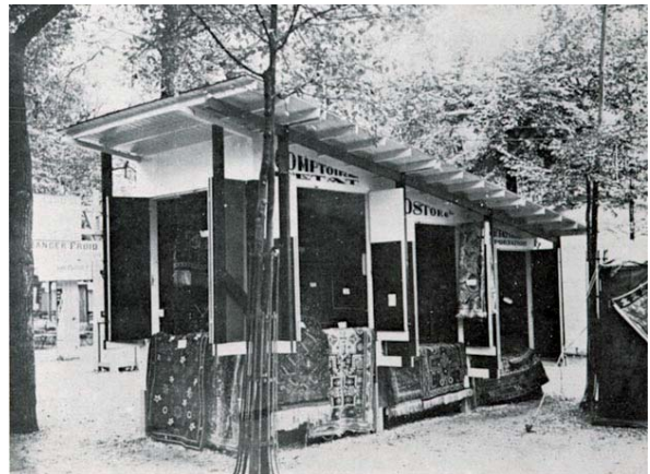
Le kiosque de Melnikov, situé devant le Pavillon de l'URSS Exposition internationale des Arts décoratifs et industriels modernes, Paris, 1925

Cette version du kiosque symbolise pour Michel Aubry les dysfonctionnements et les contradictions de l'Union soviétique au moment de l'Exposition internationale : pour des raisons économiques, les russes n'ont pas pu diffuser les objets des avant-gardes. Ils se sont donc inscrits de manière paradoxale dans la tradition des tsars russes qui exportaient les tapis caucasiens en Europe bien avant eux. Ainsi, malgré son titre, cette oeuvre n'est pas mise en musique mais porte tout de même en elle une forte dissonance, entre sa façade extérieure et son contenu.