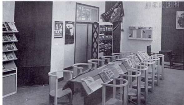
Vue d'ensemble de l'aménagement du Club ouvrier, 1925

idéologique d'un rapport renouvelé aux objets et au savoir. Dans les Galeries étrangères, Rodtchenko présentait son Club ouvrier, un ensemble de mobilier de lecture, de jeu et de socialisation destiné à être diffusé dans tout le pays, reflet d'une utopie d'intégration de tous les arts dans la vie quotidienne et de participation au progrès humain. Présenté sous forme de salle de lecture avec chaises, tables et reposeurs, cet espace cherchait à sensibiliser la classe ouvrière à la culture. Le public pouvait entrer, s'installer et lire.