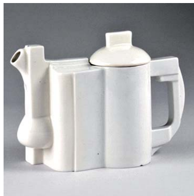
Kazimir Malevitch, théière en porcelaine, 1923