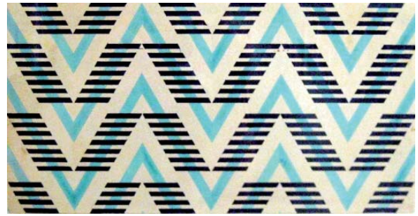
Varvara Stepanova (1894-1958), textile, années 1920