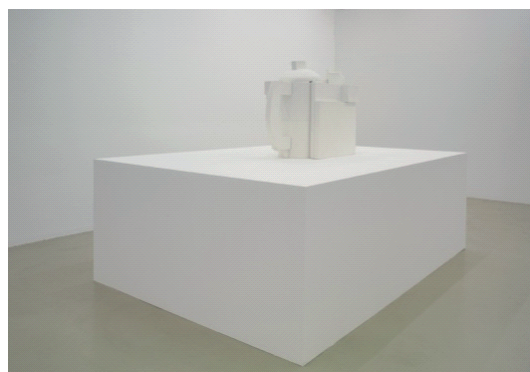
Karina Bisch, Teapot , 80 x 130 x 60 cm, plâtre, 2005 Vue de l'exposition Geometric Final Fantasy au Crédac du 9 septembre au 30 octobre 2005

Elle se mesure à une théière, créée en 1918 pour la Manufacture impériale de Saint-Petersbourg par l'artiste russe Kazimir Malevitch (1878-1935). Elle est ainsi partie d'une photographie de théière suprématisante en porcelaine et l'a reproduite en plâtre.