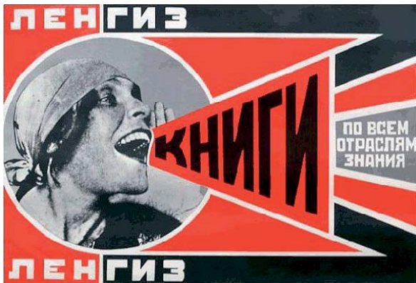
Alexandre Rodtchenko (1891-1956), « Des livres ! Pour tout savoir », affiche du département d'Etat chargé de l'édition à Leningrad, 1924

Ils s'intéressent également au graphisme et créent des livres, des tracts, des affiches. Une des œuvres majeures du constructivisme est le projet pour un Monument à la Troisième Internationale de Vladimir Tatline. La sélection d'images ci-après réunit des travaux d'artistes constructivistes (affiches, textiles, peintures...) où l'on perçoit leur fort intérêt pour les formes géométriques, les couleurs telles que le rouge, le noir, le blanc, le travail sur la composition et également les typographies.