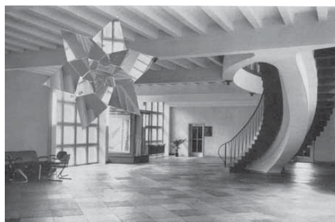
Bojan Sarcevic, 1954 , 2004 Série de soixante-seize collages

Bojan Sarcevic (né en 1974) utilise une grande variété de techniques (collage, vidéo, sculpture, installation, photographie...) et s'intéresse aux idéologies que véhiculent les époques, en questionnant plus particulièrement les enjeux du modernisme. Les questions de construction, de déconstruction et de reconstruction traversent constamment son travail. En jouant avec les propriétés de matériaux très différents, en détournant les médiums et en confrontant des esthétiques opposées, il nous invite à réfléchir sur le conflit principal qui a émergé dans les avant-gardes : celui entre la forme et la fonction.