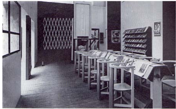
Vue d'ensemble de l'aménagement du club ouvrier, 1925

Paris, 1925. Alexandre Rodtchenko (1891-1956) séjourne à Paris pour superviser l'installation de l'exposition de l'URSS au Grand Palais, de son Club ouvrier et des kiosques de Konstantin Melnikov (1890-1974), dont il avait pensé les couleurs. Avec ses formes et matériaux simples, économiques et fonctionnels, l'architecture de Melnikov est alors la matérialisation architecturale de la nouvelle esthétique de la Révolution, l'instrument