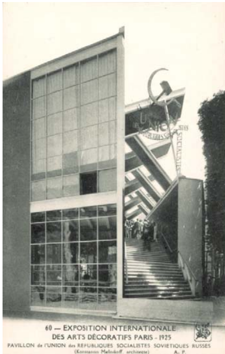
60 — EXPOSITION INTERNATIONALE DES ARTS DÉCORATIFS PARIS - 1925 PAVILLON de l'UNION des REPUBLIQUES SOCIALISTES SOVIÉTIQUES RUSSES (Konstantin Melnikov, architecte) A. P. Pavillon de l'URSS Exposition internationale des Arts décoratifs et industriels modernes, Paris, 1925

à la richesse et au luxe des autres pays. La fraîcheur et l'originalité de la création artistique de cette époque révolutionnaire doit en témoigner » 1 .