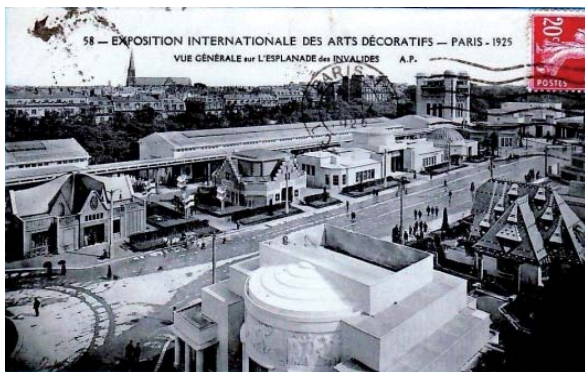
Vue générale de l'Esplanade des Invalides, Paris, 1925

Pour l'URSS, il s'agit d'affirmer sa légitimité auprès des puissances européennes et de diffuser son idéologie culturelle et socialiste. Ainsi, le rôle du pavillon est, par son architecture, de montrer l'originalité du modèle artistique soviétique. Sa sobriété contraste avec le caractère luxueux des autres pavillons, qui privilégient l'ornement et dont l'ambition est de s'adresser à un public bourgeois. Les russes seront reconnus pour leurs idées novatrices et récompensés par de nombreux prix. Ces problématiques et tensions esthétiques et politiques de l'époque (confrontation entre Orient et Occident, tradition et modernité) sont palpables dans l'exposition de Michel Aubry, qui remet en jeu ces utopies et ces idéologies dans notre contexte actuel, en réinterprétant des formes et des architectures avant-gardistes.