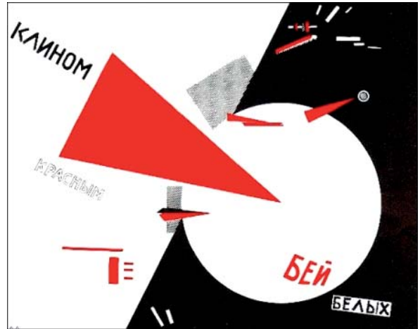
El Lissitzky (1890-1941), Beat the Whites with the Red Wedge , 1919