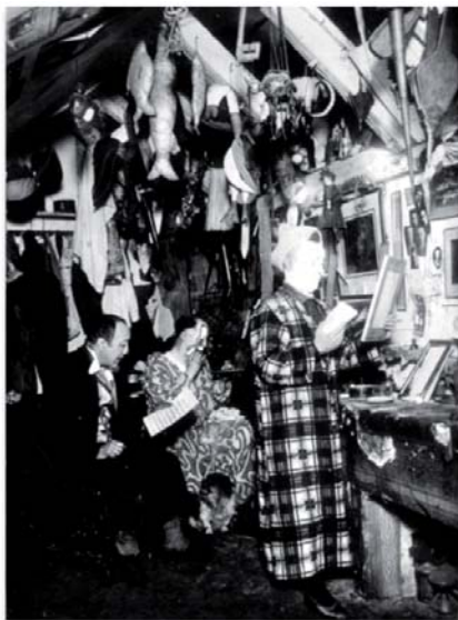
Les trois frères Fratellini dans leur loge

Dans la loge sont installés les trois chaises des frères Fratellini mises en musique, leur table de maquillage, des accessoires, ainsi qu'un ensemble de costumes, parmi lesquels la tenue d'enseignement au Bauhaus de Moholy-Nagy, le combinaison d'artiste de Rodtchenko ou encore l'habit de ville de type nouveau de Tatline. La loge est l'élément-clé de l'exposition puisqu'elle reflète les préoccupations de Michel Aubry, à savoir le jeu, le monde du spectacle, le cinéma, le déguisement, la musique et la comédie. La Loge des Fratellini est aussi avant tout une évocation de la vie d'artiste.