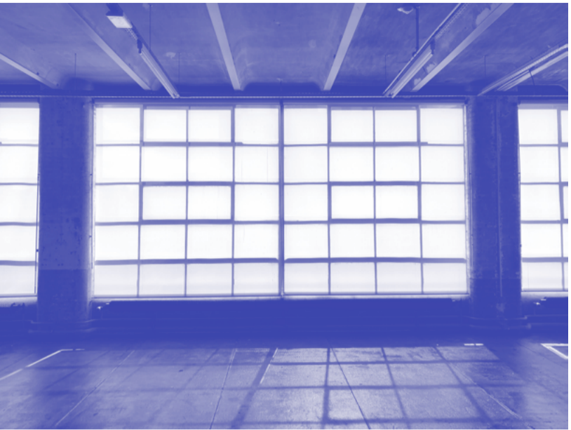
Les grandes fenêtres du Centre d'art contemporain d'Ivry — le Crédac installé dans la Manufacture des Ceillets.

Les façades du bâtiment du Crédac sont recouvertes de grandes baies vitrées. Combien d'installations dans l'exposition d'Éric Baudart sont faites de lignes verticales ou horizontales qui appellent la grille géométrique des fenêtres ? Entoure ta réponse.