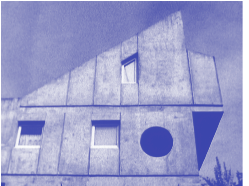
Christian Merlhiot, Promenée , 1988. Film 16 mm, noir et blanc, 11 min.

Observe cette image extraite du film Promenée de Christian Merlhiot, projeté dans le Crédakino. Quels sont les points communs entre la façade de cet immeuble de Renée Gailhoustet et les sculptures de Nefeli Papadimouli ?