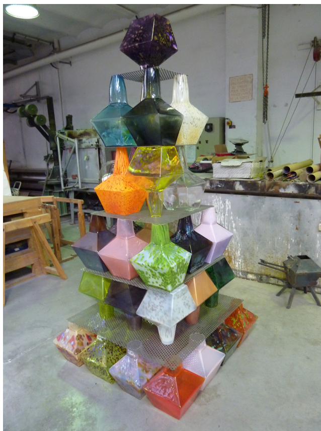
Delphine Coindet, atelier du CIRVA, 2014