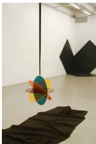
Vue de l'exposition La partie continue 2 au Crédac, 2004. Au premier plan, Delphine Coindet, Pendant 1 , 2003.

Depuis une vingtaine d'années, Delphine Coindet développe un vocabulaire sculptural à travers des dispositifs d'expositions conçus comme des mises en scène ouvertes, des collages et assemblages de matériaux et de techniques hétérogènes. L'inventivité de son langage, en constant dialogue avec l'architecture et le design, s'articule aujourd'hui autour d'une large palette d'expériences comprenant, outre l'exposition, la scénographie, la commande publique, la performance et l'édition de mobilier radical.