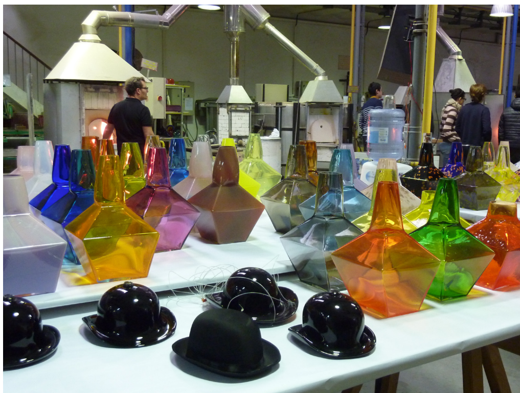
Delphine Coindet, atelier du CIRVA, 2014 © Christelle Notelet / CIRVA.

Visuels disponibles sur demande à Léna Patier, Responsable de la communication »-> lpatier.credac@ivry94.fr / +33(0) 1 72 04 64 47 — Toutes les images : © Delphine Coindet / Adagp Paris, 2015