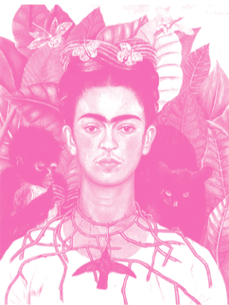
Frida Kahlo, Autoportrait au collier d'épines et colibri , 1940. Peinture à l'huile. Harry Ransom Center, Austin, Texas