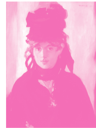
Édouard Manet, Berthe Morisot au bouquet de violettes , 1872. Huile sur toile. Musée d'Orsay, Paris