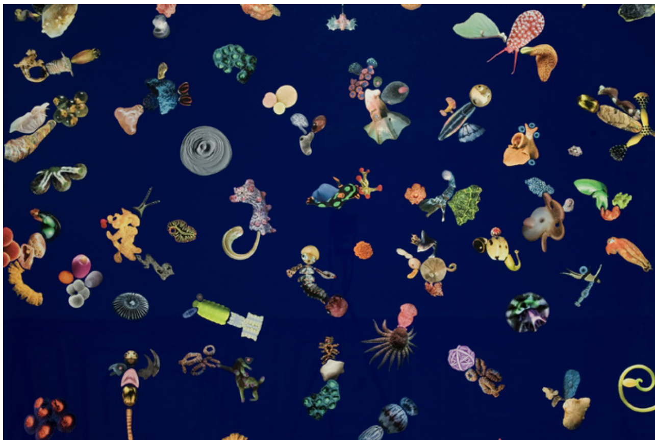
Hugues Reip, Deep Night Music (à Öyvind Fahlström ), 2007 ; Détail, Illustrations sur feuilles d'aimant, tôle peinte, 140 x 180 cm, 2007. Photo : Marc Damage. © Hugues Reip / ADAGP, Paris 2018