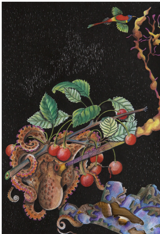
Hugues Reip, Noirs desseins (série 5, n°9), 2015/2016 Encre, crayon de couleur, aquarelle et collages sur papier, 14,7 x 21,7 cm. Collection Magnin-A. Paris © Hugues Reip / Adagp, Paris 2018

Visuels disponibles sur demande à Léna Patier / Responsable de la communication +33 (0)1 72 04 64 47 + lpatier.credac@ivry94.fr