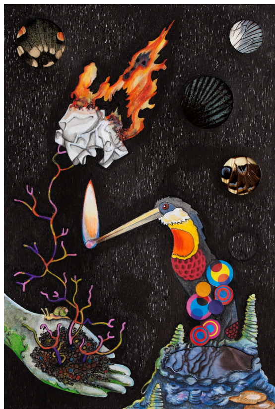
Hugues Reip, Noirs desseins (série 5, n°10), 2015/2016 Encre, crayon de couleur, aquarelle et collages sur papier, 14,7 x 21,7 cm. Collection particulière. © Hugues Reip / Adagp, Paris 2018