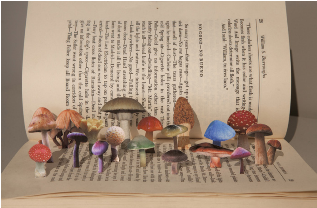
Hugues Reip, Mushbook II , 2013 Impressions numériques sur papier découpé, édition de Nova Express par William S Burroughs, Collection particulière. © Hugues Reip / ADAGP Paris, 2018.

Visuels disponibles sur demande à Léna Patier / Responsable de la communication +33 (0)1 72 04 64 47 + lpatier.credac@ivry94.fr