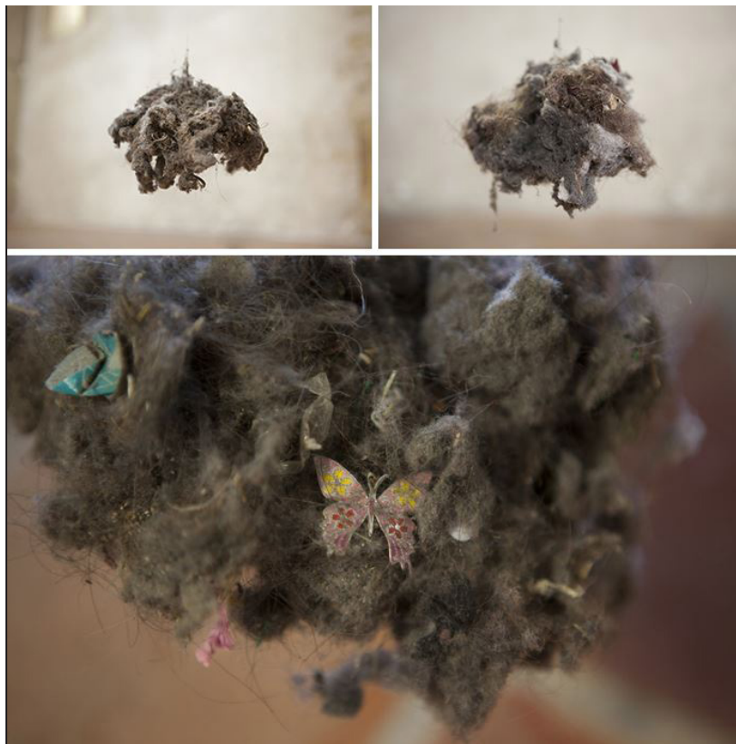
Hugues Reip, Black Sheeps (détail), 2014 Poussière, grilles métalliques, fils de kevlar, tubes en aluminium, moteurs, dimensions variables.