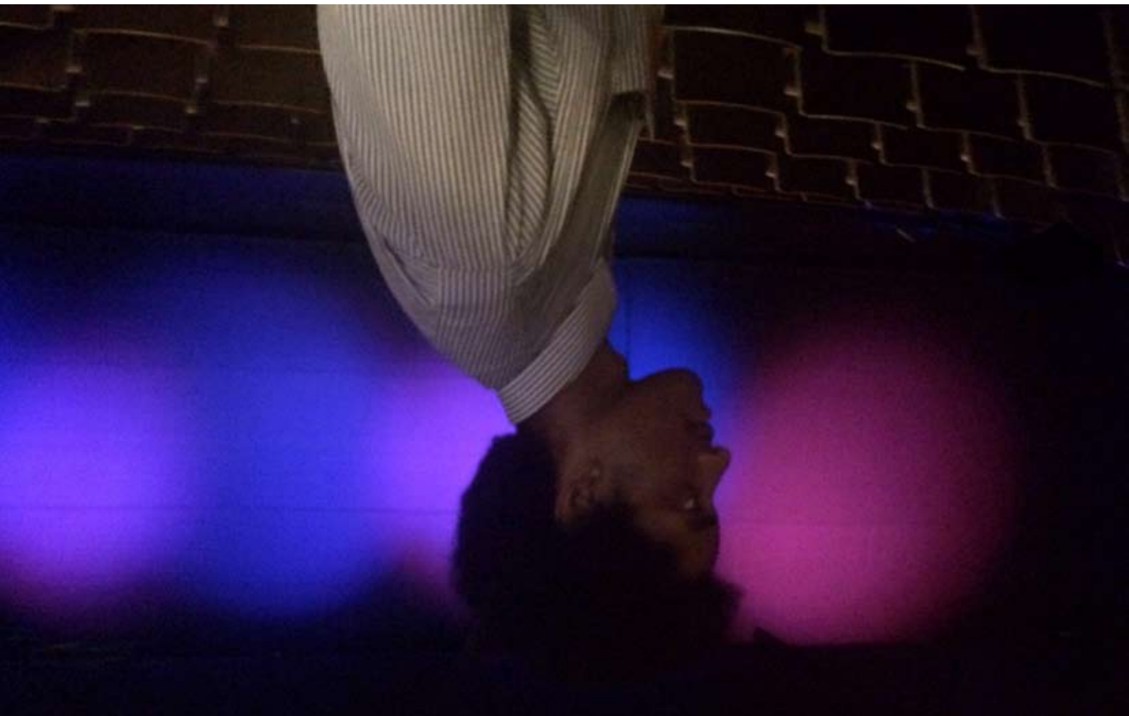
Caecilia Tripp, Going Space , 2015 Photographie contrecollée sur aluminium, 30 x 41 cm