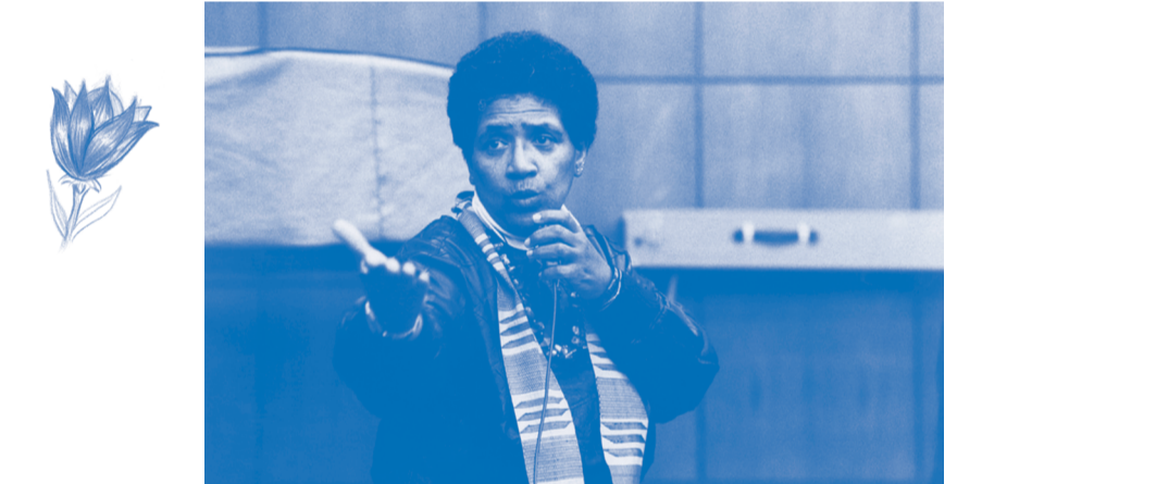
Audre Lorde au John F. Kennedy-Institute for North American Studies de la Freie Universität de Berlin (Allemagne), 1984.

Angela Davis est née aux États-Unis en 1944. C'est une philosophe et écrivaine militante pour les droits humains et pour la liberté, contre le racisme, le système des prisons et toutes les injustices dans le monde.