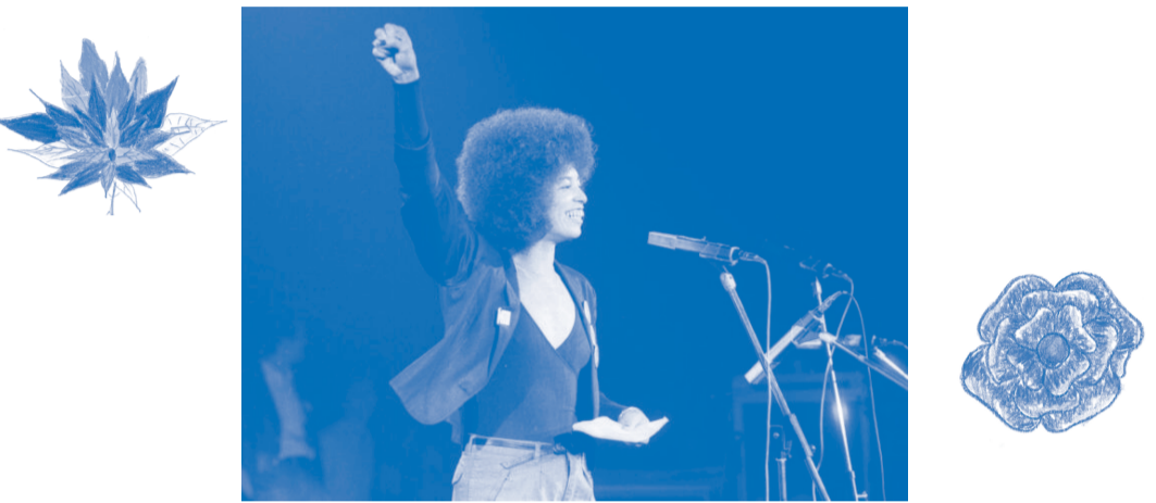
Angela Davis au Festival of Youth à Dortmund (Allemagne), juin 1981.

Toni Morrison est la première à avoir écrit des romans qui parlent de ce sujet. Comme Angela Davis et Audre Lorde, ses ancêtres étaient des esclaves. Aux États-Unis, l'esclavage a été aboli en 1863. Mais dans certaines régions du pays, on interdisait aux personnes Noires de partager le même espace que les personnes Blanches dans les lieux publics : c'est la ségrégation raciale, qui a été interdite seulement en 1964.